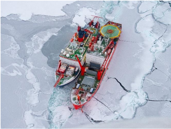
Abbildung 3: Foto der POLARSTERN und der Akademik Fedorov