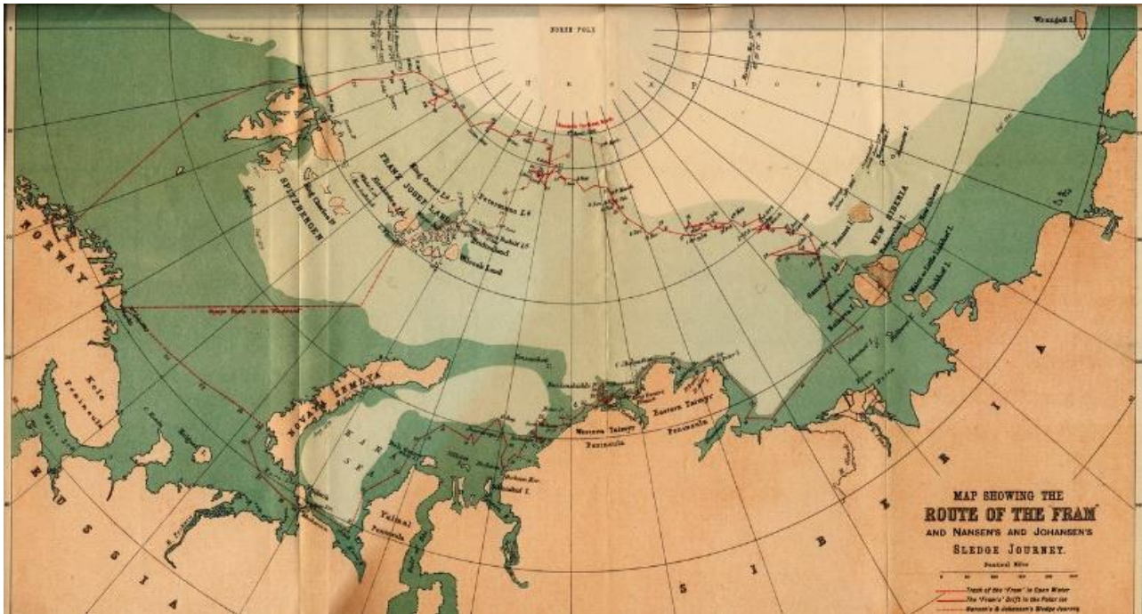
Abbildung 1: Aus Fridtjof Nansen (1896): In Nacht und Eis

Zwischen 1893 und 1896 unternahm Fridtjof Nansen die abenteuerliche Reise in die Arktis seiner Annahme folgend, dass es eine Polardrift gibt, die sein im Eis eingefrorenes Schiff einige Kilometer pro Tag über den Pol hinweg transportieren würde. Auf der Karte könnt ihr seinen Weg nachvollziehen. Am 20.09.2019 machte sich das deutsche Polarforschungsschiff POLARSTERN auf den Weg, um dem Vorbild Nansen zu folgen und mithilfe der Transpolardrift innerhalb eines Jahres den Nordpolbereich zu überqueren und die Klimaprozesse der Arktis besser zu verstehen. Begleitet wurde die POLARSTERN zu Beginn der Expedition im September und Oktober 2019 von dem russischen Schiff Akademik Fedorov. Auf ihm waren weitere Expeditionsteilnehmer*innen untergebracht sowie Nachschub an Lebensmitteln und Treibstoff.